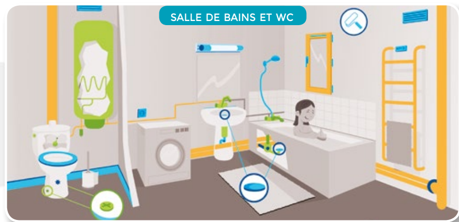
SALLE DE BAINS ET WC