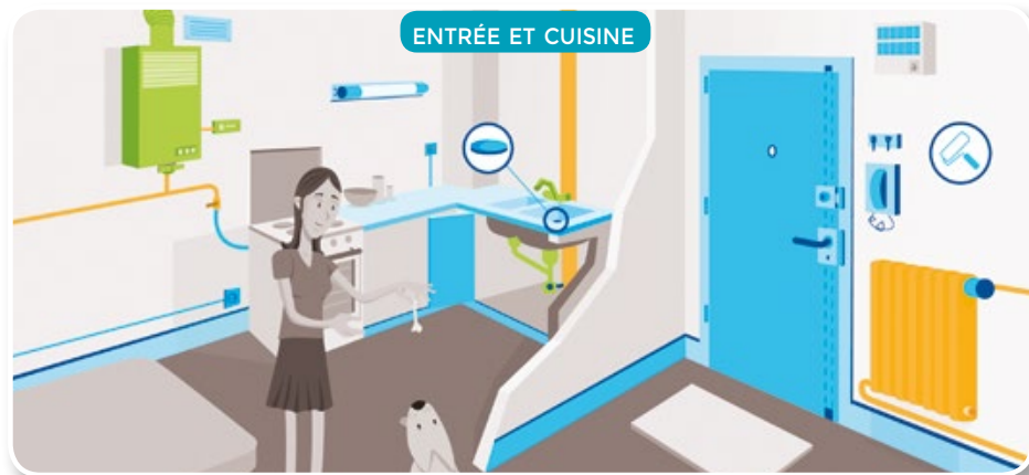
ENTRÉE ET CUISINE